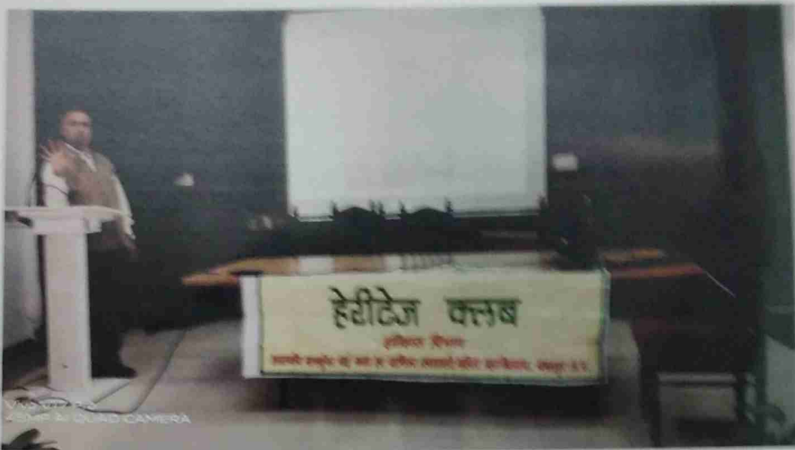
जबलपुर की ऐतिहासिक धरोहरों का प्रजेन्टेशन