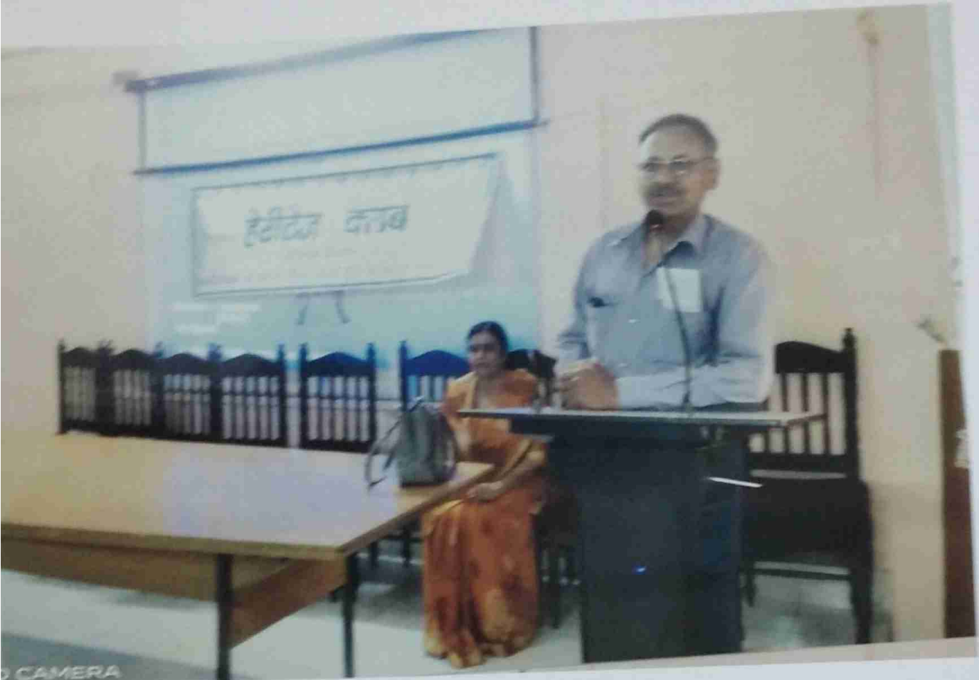
हेरीटेज क्लब कार्यक्रम