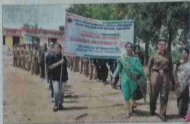
NCC cadets carrying out a rally for cleanliness at Bhatauli.