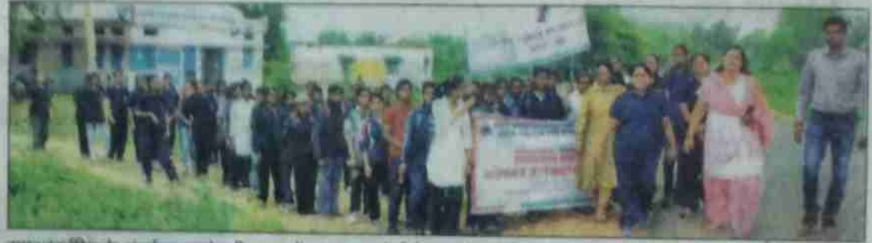
समर इंटरनेशनल के अंतर्गत नानाखेड़ा तिलवारा में जागरूकता रैली निकालती मानकुवरबाई महाविद्यालय की छात्राएं।