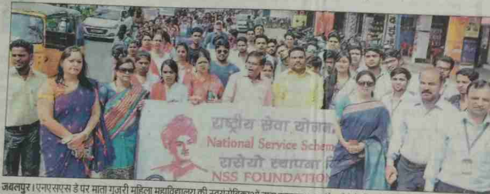
जबलपुर। एनएसएस डे पर माता गुजरी महिला महाविद्यालय की स्वयंसेविकाओं द्वारा स्वच्छता का संदेश देने के लिए रैली निकाली।