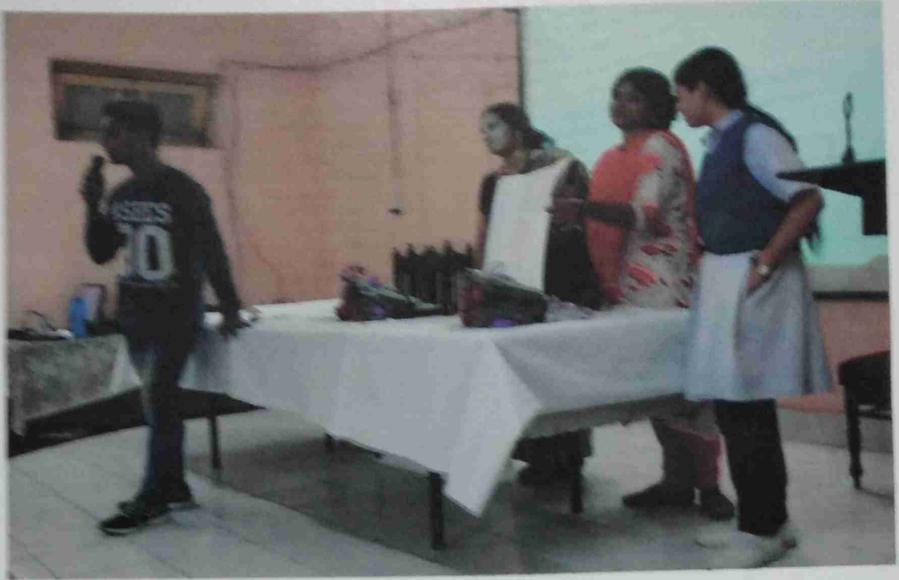
कार्यशाला में सहभागिता करते छात्र-छात्रायें