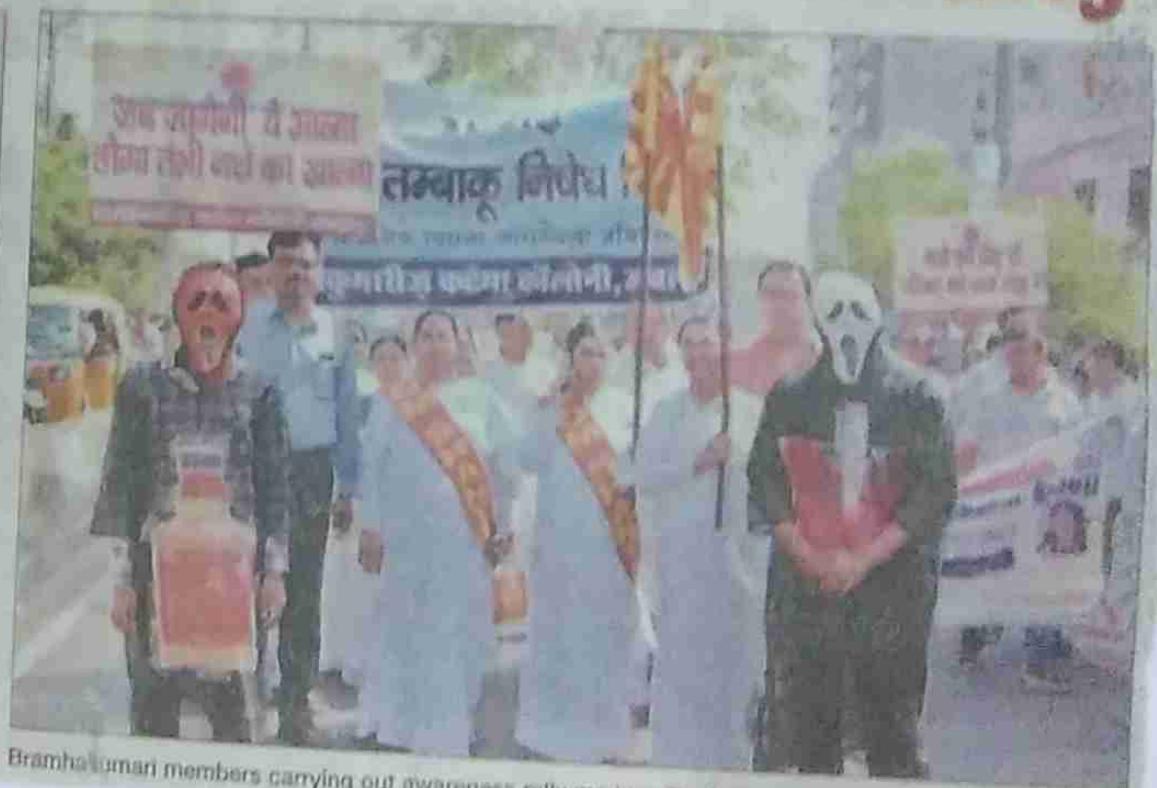
Bramhalumari members carrying out awareness rally marking De-Addiction Day.