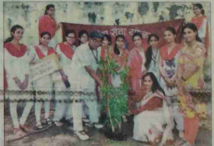
Chief guest getting sapling planted at MKB College.