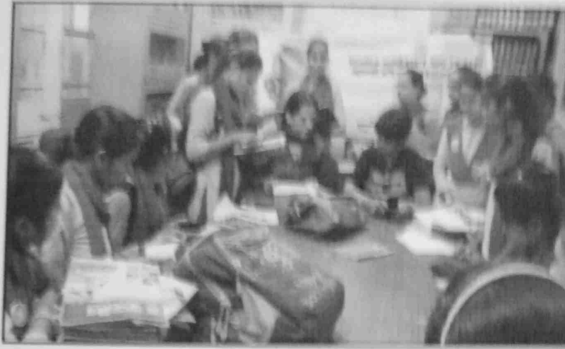
ऐतिहासिक गाँधी साहित्य का अध्ययन करती छात्राएँ एवं प्रकोष्ठ प्रभारी