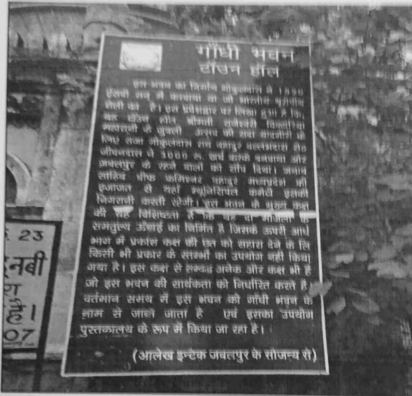
गाँधी ग्रन्थालय का इतिहास