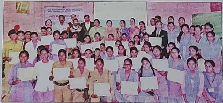
Students displaying their certificates during the programme.