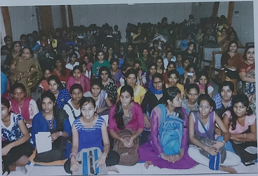
४ मार्च १७ उपस्थित छात्राएँ