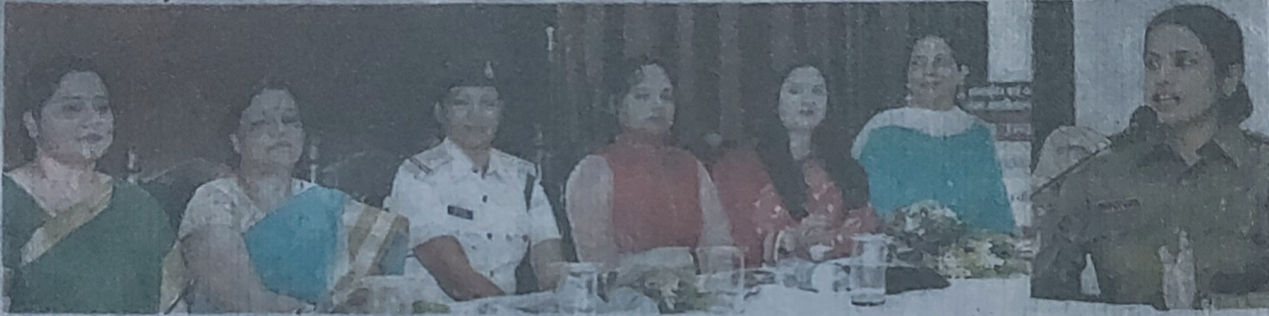
सिटी रिपोर्टर | जबलपुर

मानकुंवरबाई कॉलेज में गर्ल्स ने जाने आत्मरक्षा के गुर, सवाल पूछते पर जवाब के साथ मिले उपहार