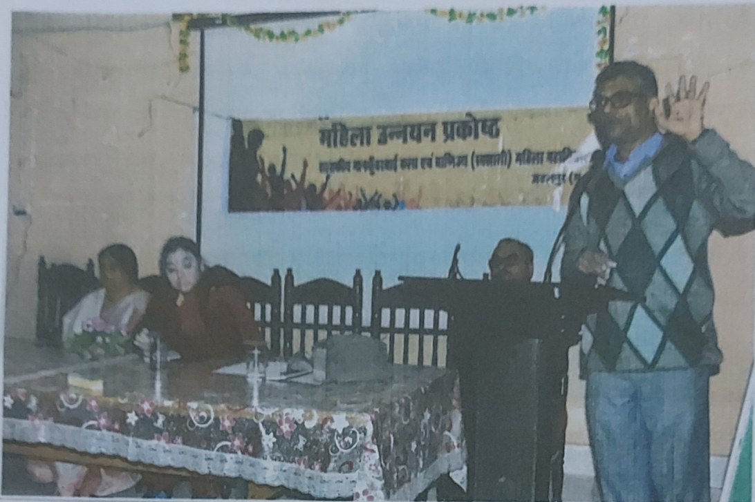
28.11.17 को ऑडिट कार्यक्रम महिला सुरक्षा