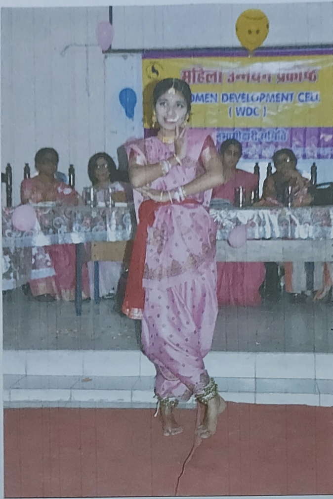
४ मार्च १७ अन्तरराष्ट्रीय महिला दिवस पर पदा. की दागा की प्रस्तुति